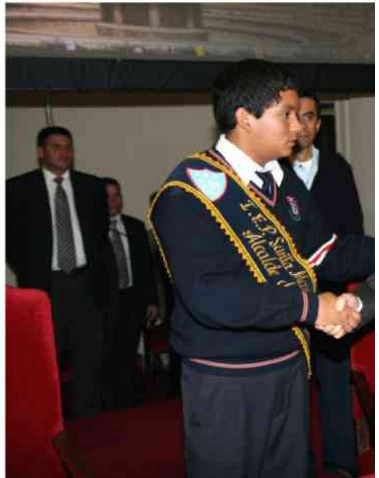
Presidente del Poder Judicial recibe saludo del alcalde

“Levantamos nuestras voces por las más de 11 mil víctimas de abuso sexual infantil reportadas en los últimos años y para decir