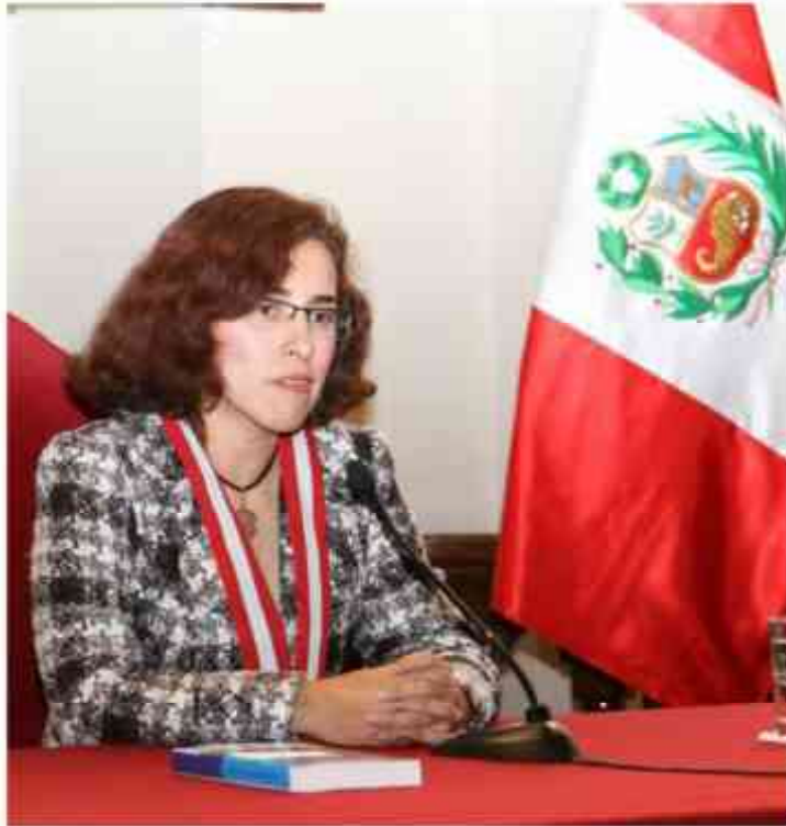
Consejera Sonia Torre Muñoz

L a doctora Sonia Torre Muñoz, integrante del Consejo Ejecutivo del Poder Judicial (CEPJ), a través de una comunicación remitida al Viceministro de Justicia doctor Erasmo Reyna Alcántara, informó que el Poder Judicial está cumpliendo con los objetivos trazados en el Plan Nacional de Lucha contra la Corrupción que impulsa el Poder Ejecutivo.