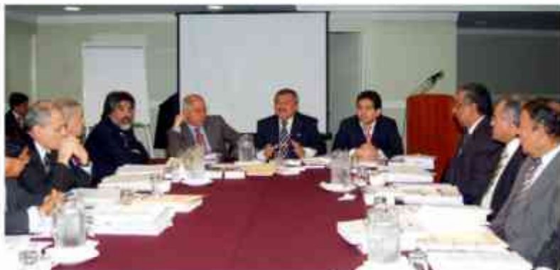
IV Pleno Jurisdiccional Supremo Penal, julio 2008

Asimismo, acordó la realización del Pleno Regional Nuevo Código Procesal Penal en Arequipa, los días 03 y 04 de julio con jueces de Arequipa, Huaura, La Libertad, Moquegua y Tacna.