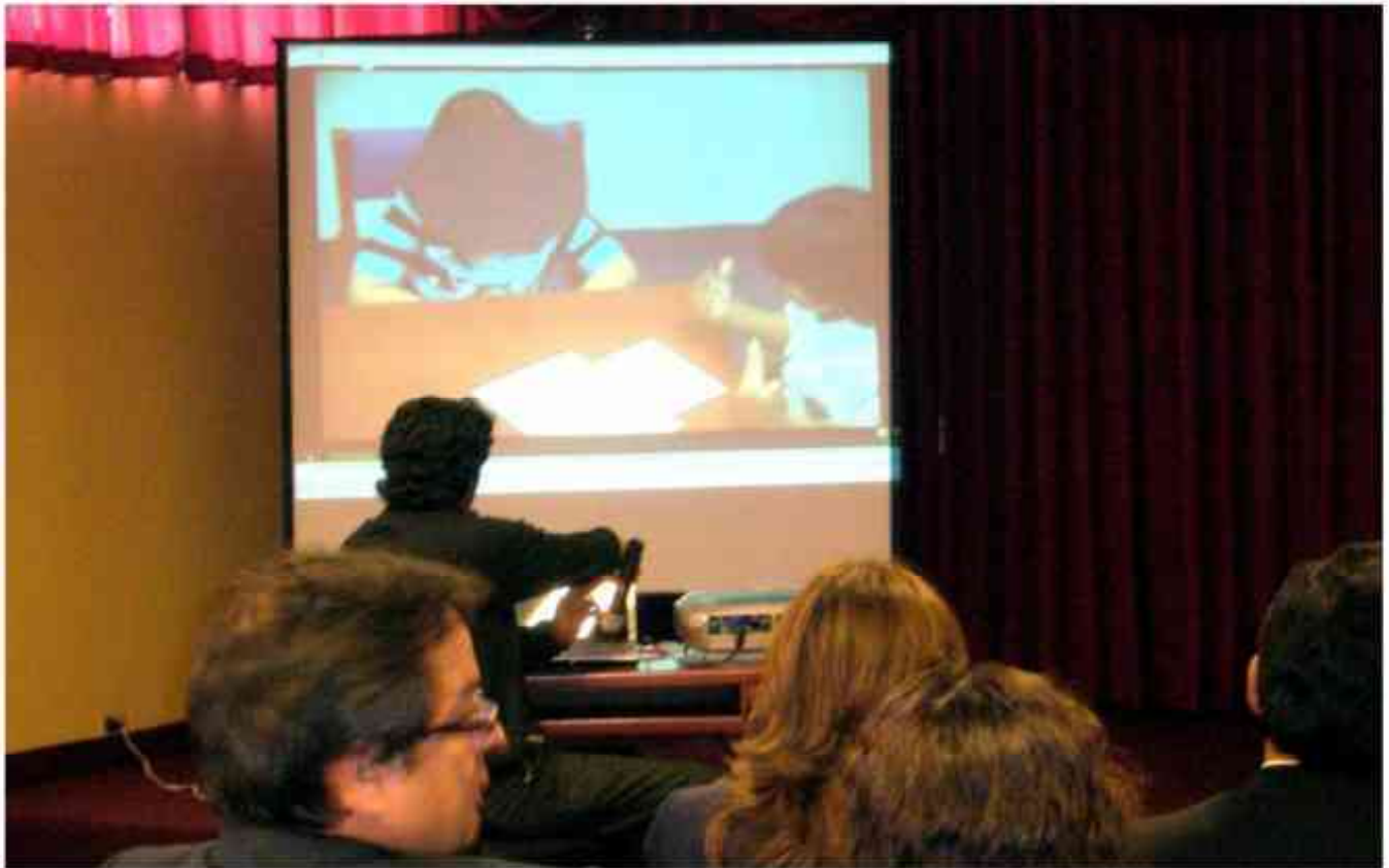
Capacitación sobre el uso de la Cámara Gessel se llevó a cabo en la CSJ del Callao

Los jueces y fiscales penales y de familia del Distrito Judicial del Callao sostuvieron una reunión de coordinación y explicación del funcionamiento de la Cámara Gessel, implementada recientemente como plan piloto en las instalaciones del Ministerio Público de la Provincia Constitucional del Callao para preservar el trato digno a los niños y adolescentes víctimas de violencia sexual.