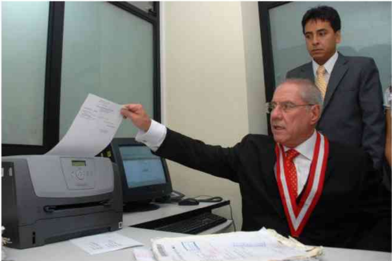
Envío de la primera notificación electrónica

"Un Poder Judicial débil puede afectar entre un 15 y un 25 por ciento del crecimiento económico del país"