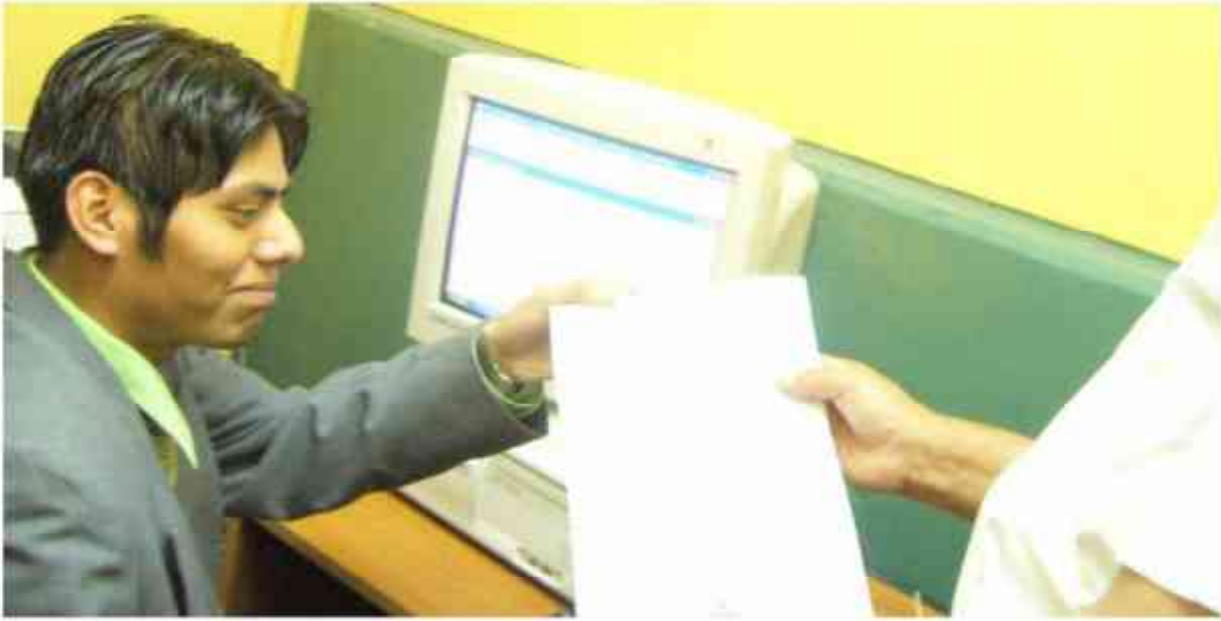
Interno de penal Sarita Colonia recibe información