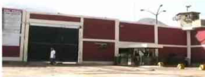
Frontis del penal de Lurigancho

Agregó que por ahora está planificando su viaje a la zona del Valle de los Ríos Apurímac y Ene (VRAE), y consideró posible que la paz llegue a dicha zona con la presencia del diálogo y la justicia.