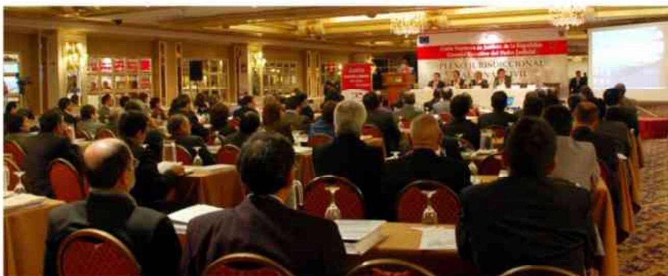
Pleno Jurisdiccional Nacional Civil, junio de 2008