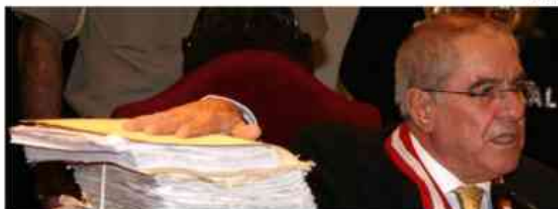
Doctor Javier Villa Stein junto a expediente judicial

“Todos los expedientes deben ejecutarse en el acto. No se debe esperar 30 meses o 15 años para resolverlo”