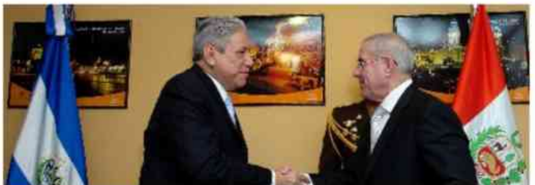
Presidentes de Cortes Supremas de El Salvador y Perú

El doctor Villa Stein viajó a El Salvador para asistir como representante especial del Presidente de la República en la transmisión de mando del doctor Mauricio Funes Cartagena, nuevo mandatario del país centroamericano.