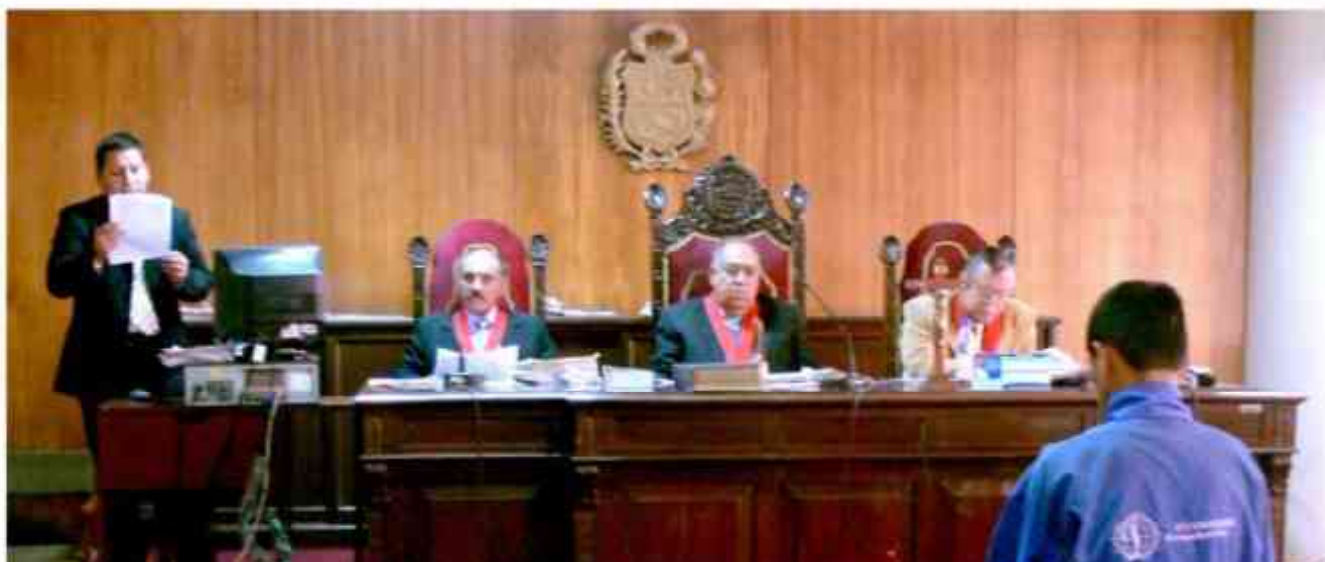
Vocales de la Tercera Sala Penal para Reos Libres